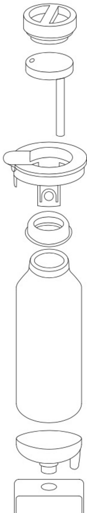
ピクニックストッパー (移動・保温用)