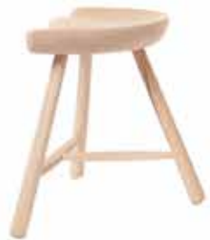
No.27 H:29×W:35×D:24cm ¥ 27,000 (税別)