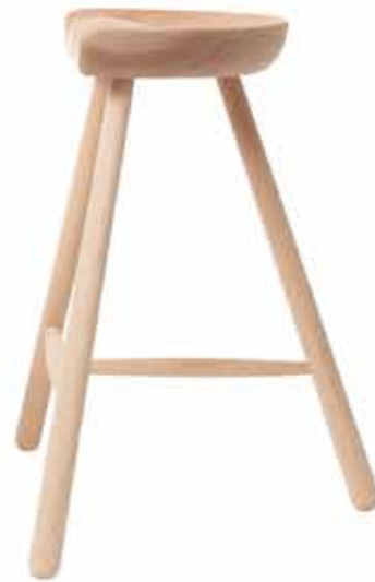
No.59 H:59×W:59×D:45cm ¥ 39,000 (税別)