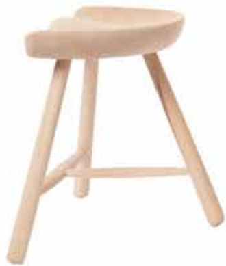
No.42 H:42×W:46×D:36cm ¥ 32,000 (税別)