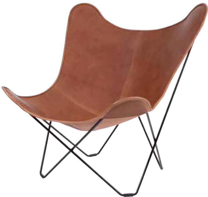
ブラウンレザー ¥136,000(税抜)