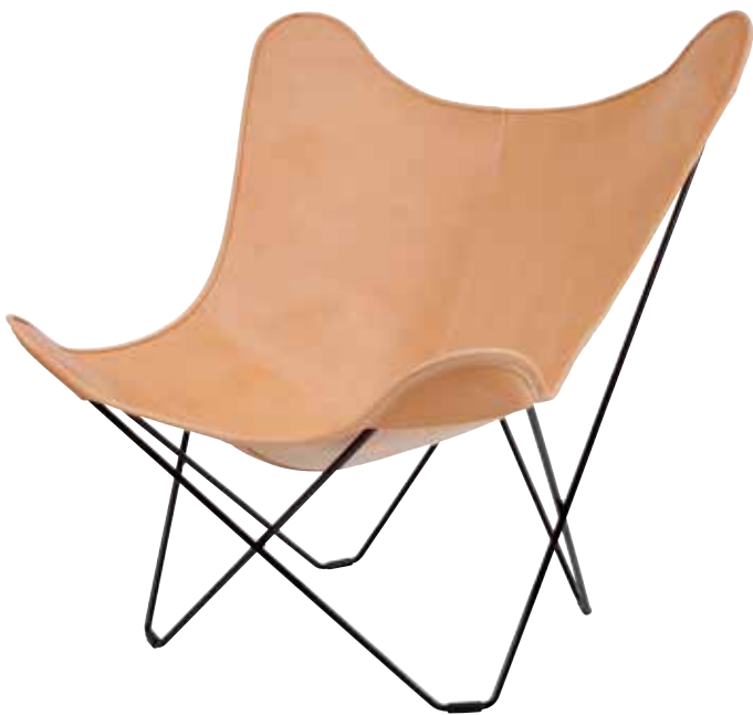
ナチュラルレザー ¥145,000(税抜)