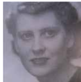
DESIGNER Grethe Komerup Bang 1913-1994

スチール製のペーパーバスケットはデンマークの女性デザイナー、グレテ・バンクにより1955年にデザインされ、オルスコフ社が生産しています。彼女は建築家としての教育を受けており建物の設計で有名です。オルスコフ社のアイコンアイテムにはフィン・ユールによってデザインされた製品なども生産されています。