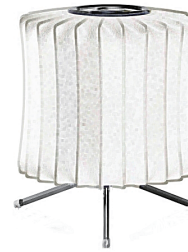
Nelson Lantern Tripod Lamp

このたびは、ハーマンミラー社ネルソンバブルランプの商品をお買い上げいただきまして、誠にありがとうございます。 この取扱説明書をよくご覧のうえ、正しくご使用ください。 ご不明な点がございましたら販売店にご相談ください。