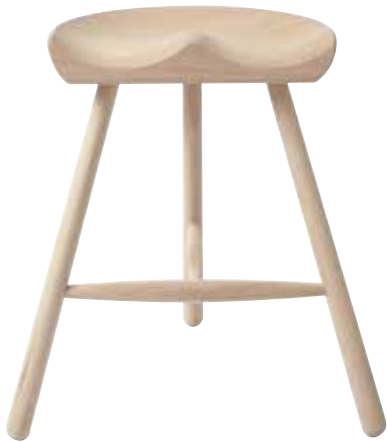
ビーチナチュラル (無塗装)