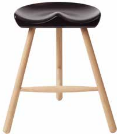
No.49 H:49×W:53×D:40cm 座面 (ビーチ・ブラックラッカー塗装)×脚 (オーク・ナチュラル) ¥45,000 (税別)