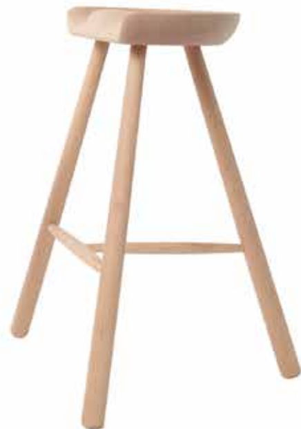
No.69 H:69×W:61×D:46cm ¥ 42,500 (税別)