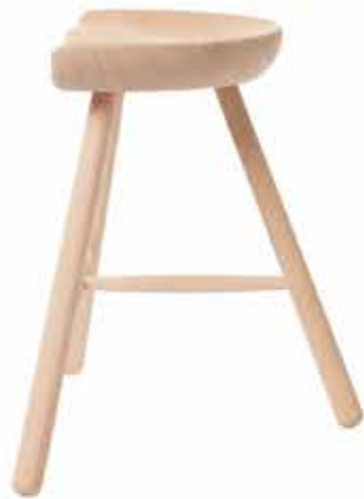
No.49 H:49×W:53×D:40cm ¥ 32,000 (税別)