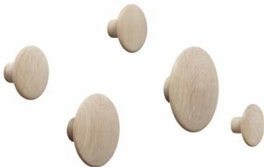
Color: Natural [ナチュラル]

ドッツは従来のコートフックに新しいスタイルを提案したアイテム。すでにデザインアイコンとして知られている丸いフォルムは、オークの無垢材を削り出したシンプルなデザインとサイズのバリエーションにより、アレンジ次第で壁面に多様な表情を生み出します。玄関・キッチン・ベッドルームなど室内のあらゆる場所でコートやプランターを掛けるだけでなく、オブジェとしてもインテリアを彩ります。