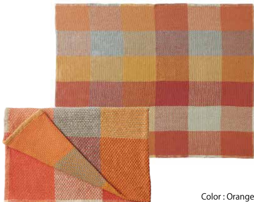
Color : Orange

ダイナミックなチェック柄が印象的なコットン100%、手織りによる柔らかなブランケット。適度な厚みと軽やかな質感で、ソファのうえにきれいにたたんでおいても、椅子に無造作に掛けるだけでも様になります。カラーバリエーションはオレンジとブルーの2色。深みのある豊かな色彩が魅力です。