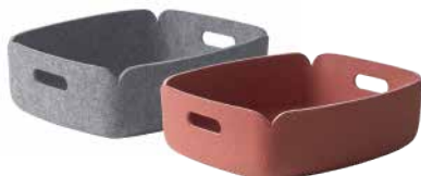
TRAY: Grey [グレイ]