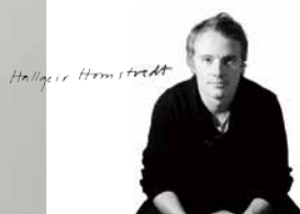
Designer : Hallgeir Homstvedt

フラワーベースの底部につけたマグネットが、トレーへの固定を可能にし、転倒を防ぎます。好みや用途に合わせて自由にレイアウトができるほか、フラワーベースそのものの独自の美しいフォルムは花を入れなくても目を楽しませてくれます。