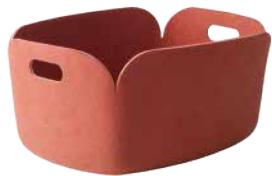
BASKET: Rose [ローズ]