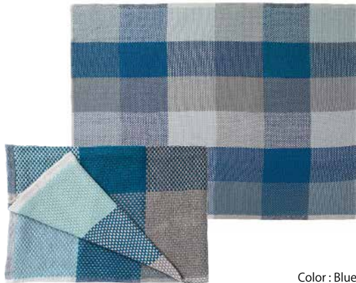
Color : Blue