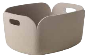
BASKET: Sand [サンド]