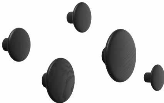
Color: Black [ブラック]