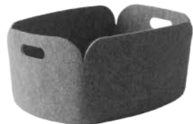
BASKET: Grey [グレイ]