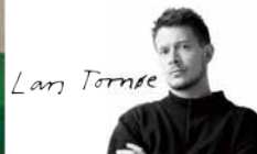
Designer : Lars Tornøe