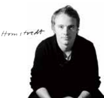
Designer : Hallgeir Homstvedt

フラワーベースの底部につけたマグネットが、トレーへの固定を可能にし、転倒を防ぎます。好みや用途に合わせて自由にレイアウトができるほか、フラワーベースそのものの独自の美しいフォルムは花を入れなくても目を楽しませてくれます。