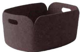
BASKET: Brown [ブラウン]