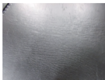
シボ牛の毛穴密度によるシワ