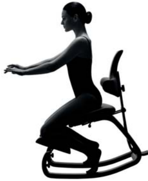
図4：Thatsit バランスチェアは、ユーザーが片足を床について椅子をロッキングしながら、もう片足を折り曲げてすね当てに乗せる座り方により、足の静脈流量を増やし、体の血液循環を活性化し、足のむくみが抑制されるようデザインされたものです。Strancen は、ユーザーがこの椅子に3種類の異なる座り方をすることが出来、それぞれの座り方が心臓への血液循環を活性化するとともに、足のむくみを防止する、と2000年の論文で述べています。