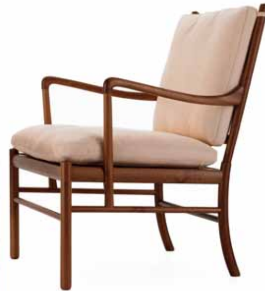
PJ-149 Colonial Chair

高さ :46cm 幅 :60cm 奥行 :40cm モンタナレザー ¥239,400(税込) 楓 ¥219,450(税込) オーク ¥208,950(税込) アッシュ ¥219,450(税込)