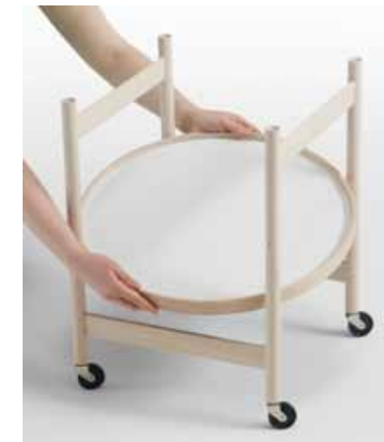
裏と表の天板組み合わせによるカラーバリエーション