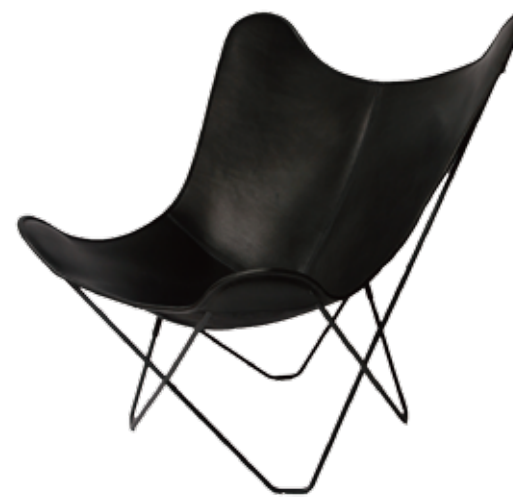
1938 Made in Sweden Cuero